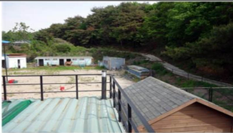
체험관에서 마사 조망